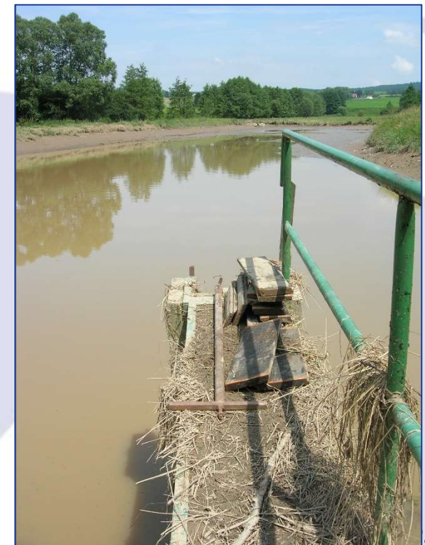
Bohunický rybník 2009