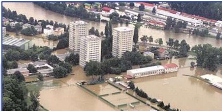
České Budějovice 2002

Evidenční listy HPPS http://hydro.chmi.cz/hpps/ ⇒ Evidence hlásných profilů