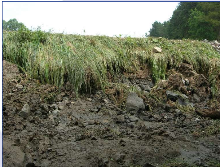
Bohunický rybník - hráz 2009