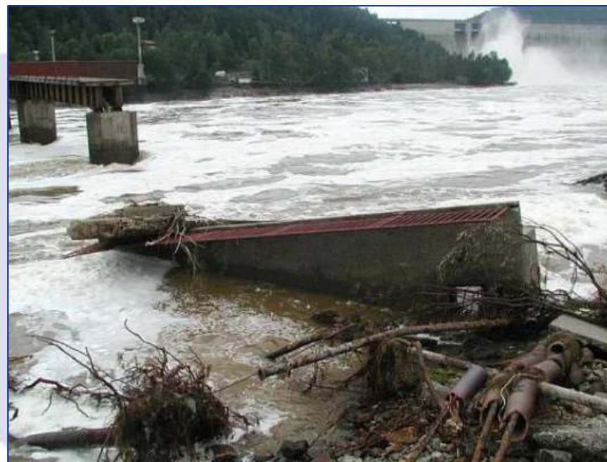
Pod VD Orlík 2002